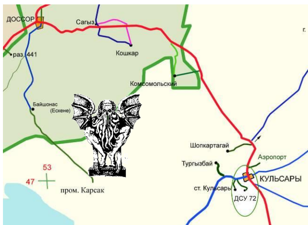
А — по Лавкрафту