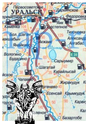
В — по Дерлету